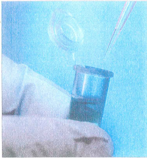
Begleitung bei klinischen Studien von der Logistik bis zur Dokumentation